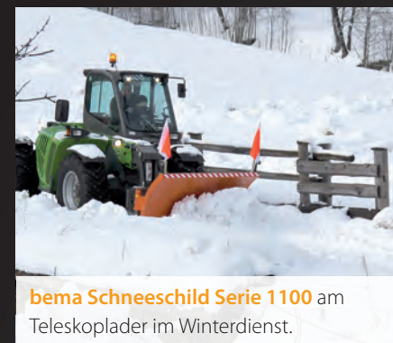
bema Schneeschild Serie 1100 am Teleskoplader im Winterdienst.

Technische Daten und Gewichte sind annähernd und unverbindlich.