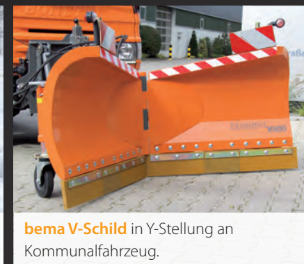
bema V-Schild in Y-Stellung an Kommunalfahrzeug.