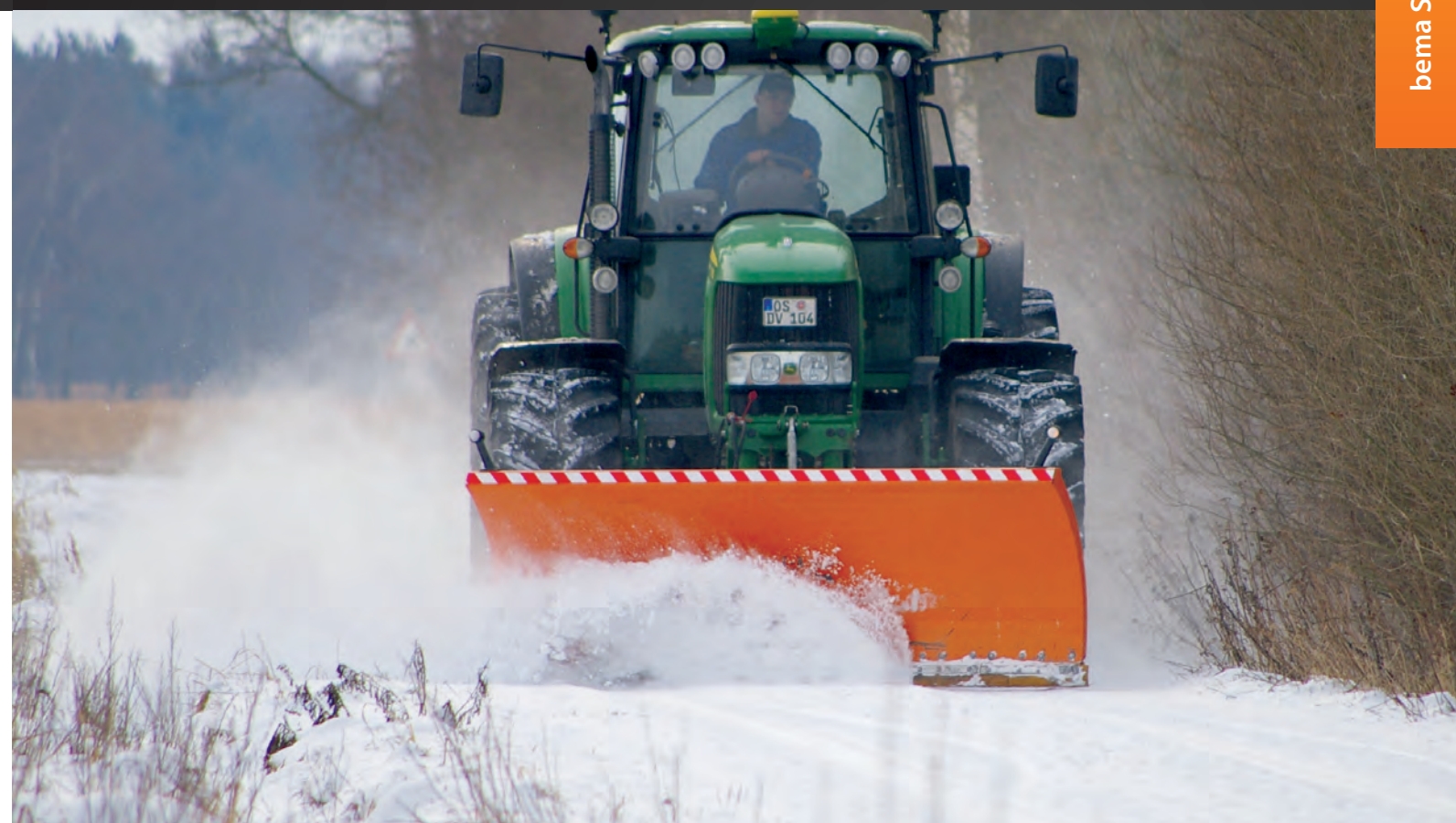
Variante 1: Schneeschild mit Federklappen und Laufrädern.